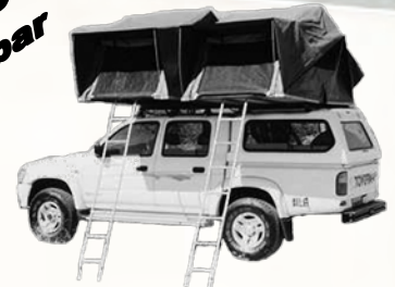
4 x 4 Camper Double Cab

für Reisen nach Namibia, Botswana, Südafrika, Zambia, Zimbabwe, Mocambique