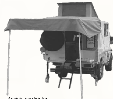
Ansicht von Hinten

Weitere Mietfahrzeuge und Fahrzeugbeschreibungen sowie aktuelle Spezials finden Sie im Internet unter: www.nature-trekking.de